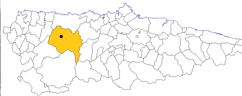
CONCEJO DE TINEO